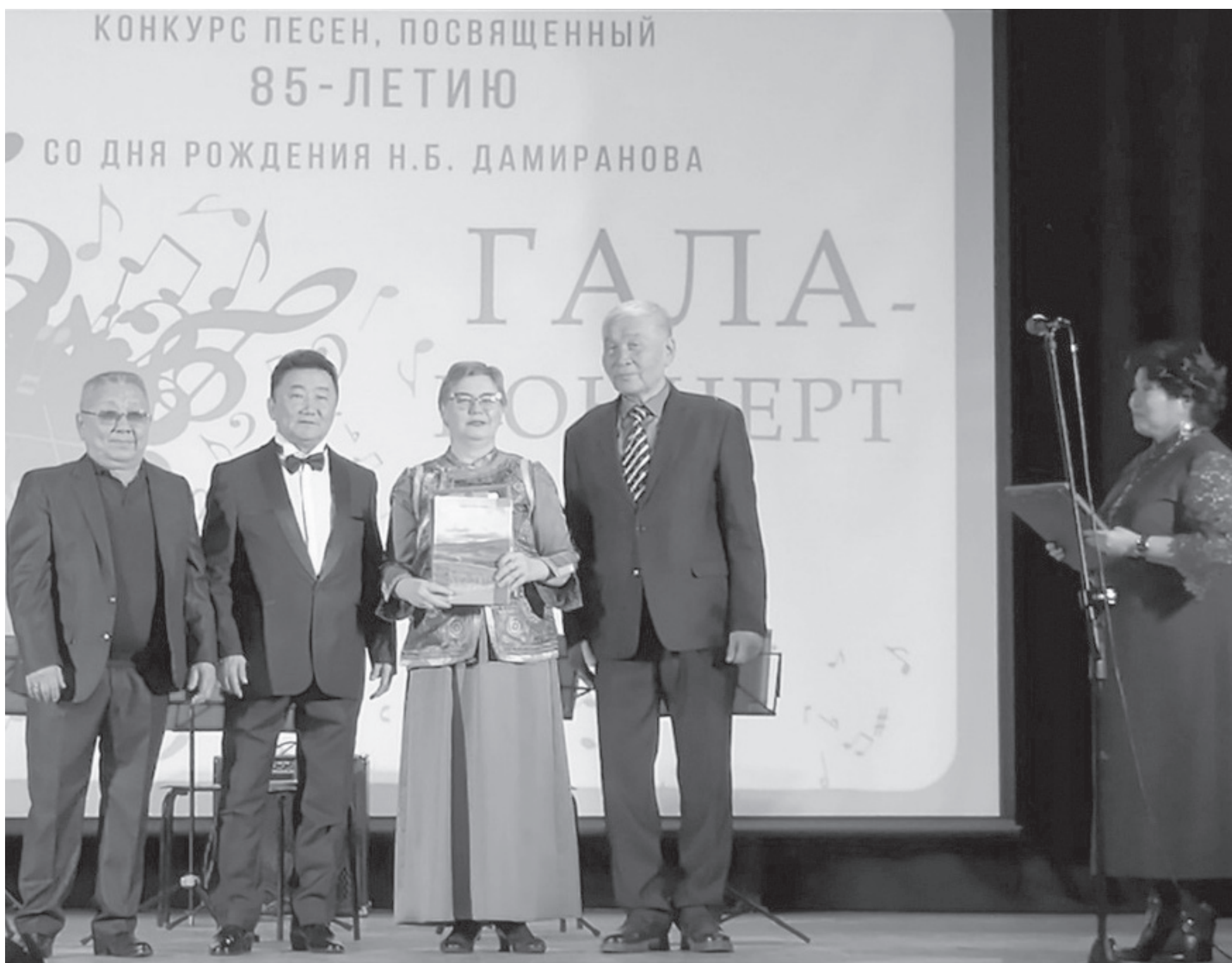
Сэлэнгын аймагтай Захиргааны гэрэл зурагууд

С элэнгын аймаг Дэбээн нютаг тоонтоты, манай Буряады суута хүгжэм найруулагча Найдан Бадмацыренович Дамирановы 85 жэлы ойдо зорюулагдсан Пурбо Найдан Дамирановууды дунууды эрхимээр гүйсэдхэгшэды тэмсээн Гусиноозерск хотын «Шахтер» гэсэн соелы байшанда ноябриин 19-дэ үнгэрөө.